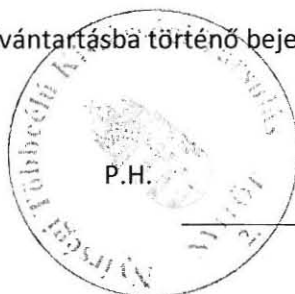
Jászai Menyhért társulási tanács elnöke