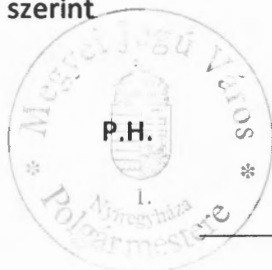
Dr. Kovács Ferenc polgármester

Kelt: Nyíregyháza, 2024. időbélyegző szerint